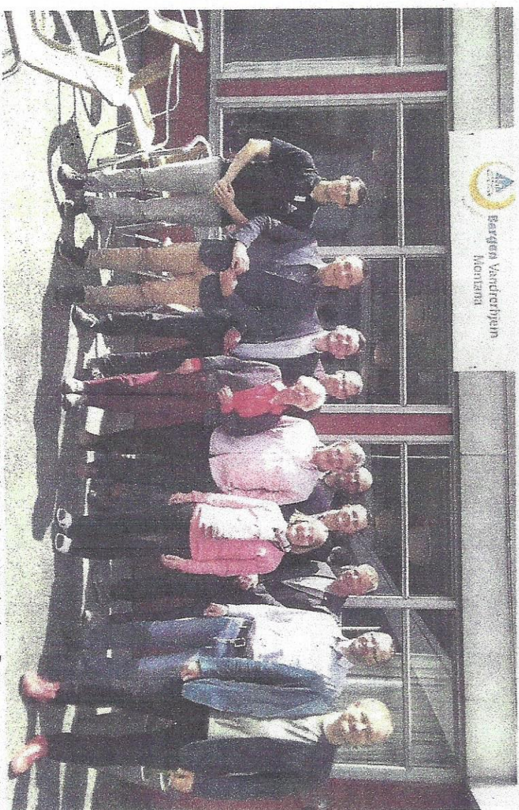
Delegacja zachodniopomorska z przedstawicielami Norwegii i Niemiec podczas spotkania w Bergen

Niedawna wizyta w Bergen zachodniopomorskiej delegacji przedstawicieli Oddziału Zachodniopomorskiego Polskiego Towarzystwa Schronisk Młodzieżowych i Urzędu Marszałkowskiego ma przynieść niebawem wymierne efekty wspólnej pracy i podnieść atrakcyjność funkcjonowania zachodniopomorskich schronisk